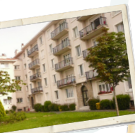
Résidence Pioche, Biarritz, 1955.