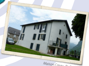
Maison Casau, Bielle, 1999.