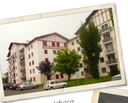
Résidence Ichaca, Saint-Jean-de-Luz, 1976.