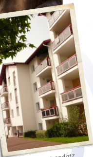
Résidence Irandatx Hendaye, 1998.

À cette époque, un service d'astreinte est mis en place pour que l'OFFICE64 soit joignable 24h/24 et 7j/7. Par ailleurs, des formations au personnel sont proposées pour améliorer constamment le service et toujours mieux répondre aux diverses demandes des locataires.