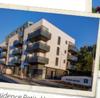
Residence Petit désir, Anglet, 2019.