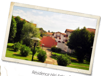
Résidence Hiri Artea, Bidart, 1988.