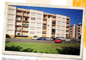
Résidence Gaston Cambot, Jurançon, 1963.

Des groupes immobiliers de taille plus importante voient le jour comme Gaston Cambot à Jurançon avec ses 110 logements.