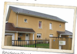
Résidence l'Escole, Lasclaverie, 2001.

Il connaît une montée en puissance de la production et une diversification de ses activités, tout en maintenant une qualité de gestion et un service renforcé. Entre 2005 et 2009, l'Office s'engage pleinement dans le plan d'urgence logement.