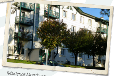
Résidence Montbrun, Anglet, 1957.