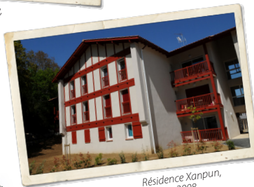
Résidence Xanpun, Ahetze, 2008.