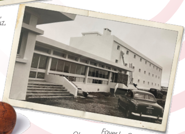
Foyer La Gravette, Oloron-Sainte-Marie, 1970.