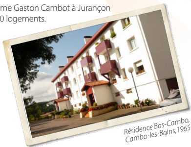
Résidence Bas-Cambo, Cambo-les-Bains, 1965.