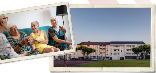
Résidence St Cricq, Bizanos, 2020.

Fort de près de 12 000 logements, avec l'appui de ses 215 collaborateurs, l'OFFICE64 s'appuie sur des compétences fortes et une réelle expertise.