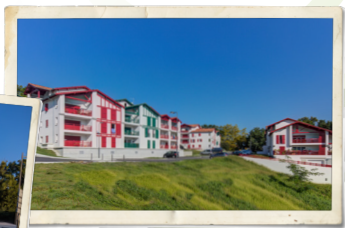
Lotissement Oiharzabalenia, Saint-Pierre-d'Irube, 2018.