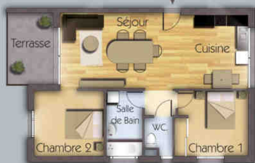
1 exemple d'appartement T3