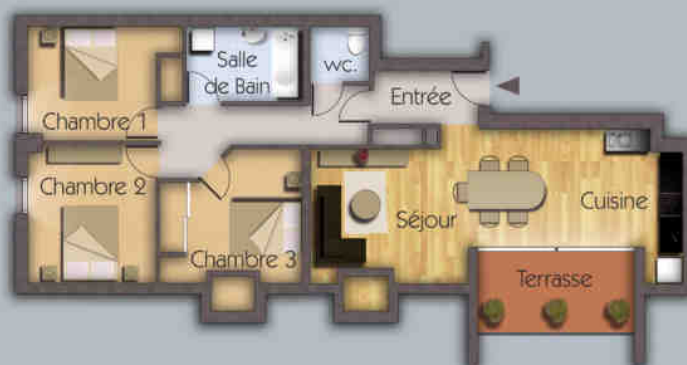
1 exemple d'appartement T4

■ Dominés par une toiture de tuiles en ardoise et dotés de combles aménagés, les bâtiments sur 4 niveaux proposent une architecture sobre et élégante, pensée dans le plus pur respect de la tradition locale. Parfaitement agencés, l'ensemble des logements dispose de beaux volumes, d'une sortie sur l'extérieur avec une vue dégagée sur un parc arboré, et d'un parking en sous sol.